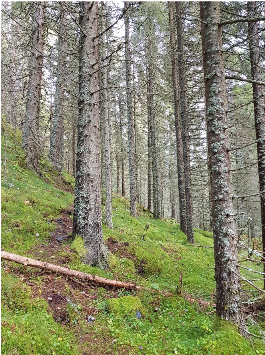
Foto fra sørlig del av planområde sett mot nord.

Planområdet ligger på Løvset i Melhus kommune. Området ligger mellom ca. 160 – 215 meter over havet, og består av to langsgående rygger med et våtere lavereliggende parti imellom. Det var tidvis svært bratt på begge sidene av begge ryggene.